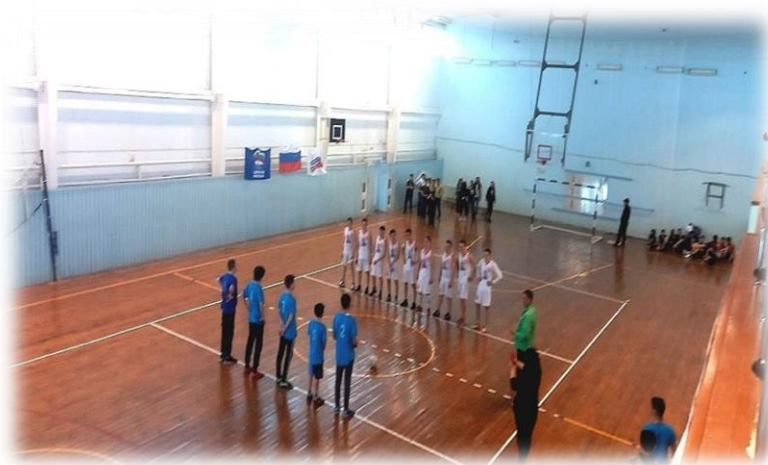
Турниры по мини-футболу

Согласно календарному плану физкультурно - массовых и спортивных мероприятий в 2022 году было проведено более 70 мероприятий.